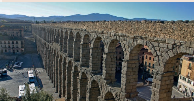
Aqueduc à Segovia (Espagne) – seulement une partie d'un approvisionnement romain en eau ou également une démonstration de la prétention romaine au pouvoir ?

Il semble que les ingénieurs romains aient utilisé la construction de conduites d'eau pour montrer tout le spectre de leurs compétences. Ainsi, dans la construction des ponts d'aqueduc, des dimensions deviennent visibles comme si on avait voulu franchir les limites de la gravité. Les valeurs qui ont été mesurées dans le tracé gravitaire, jettent le doute sur les résultats de mesure déterminés de nos jours. Dans l'ensemble, un travail minutieux de planification et d'arpentage devient reconnaissable.