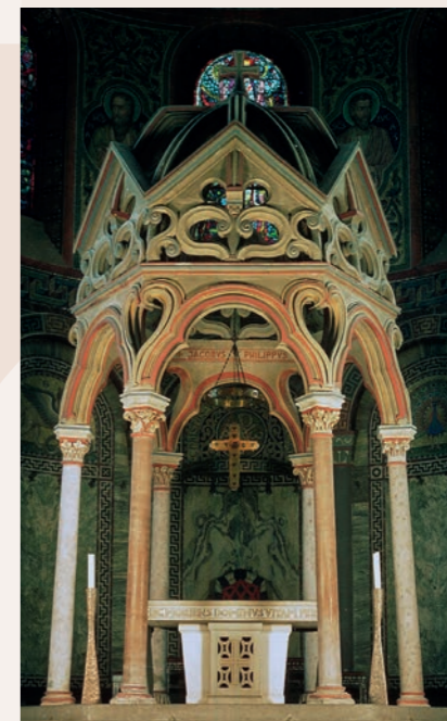
Maria Laach (Rhénanie-Palatinat): Les colonnes à l'avant du baldaquin au-dessus du maître-autel sont en concrétions de calcaire du canal romain.

En l'absence d'autres pierres précieuses, ce „marbre d'aqueduc“ servait à décorer des bâtiments romains.