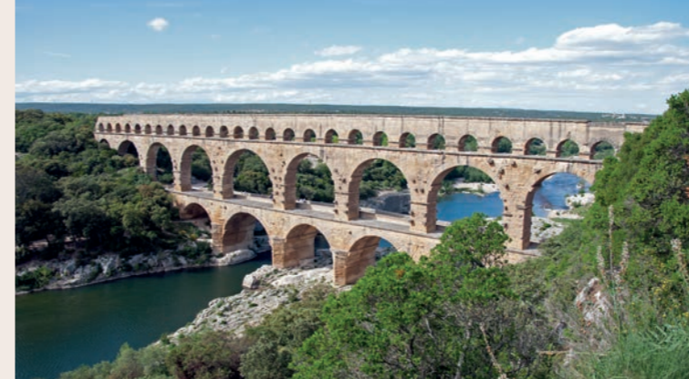
Nîmes, Pont du Gard

Ici, pour la première fois, la division d'un chantier antique en lots de construction a été prouvée archéologiquement : un bassin de dissipation massif a formé la jonction entre deux tronçons de ligne. Les bassins de captage des sources, les ponts, les réservoirs et les bassins de sédimentation ont non seulement fait l'objet de fouilles archéologiques, mais ils ont également été restaurés et, où nécessaire, recouverts de structures de protection et rendus accessibles au public le long du sentier de randonnée du Römerkanal – un des premiers sentiers de randonnée à thème archéologique en Allemagne. A l'aide de photos, de la documentation des fouilles et de maquettes, l'exposition donne un aperçu complet de la diversité de ce bâtiment architectural grandiose.