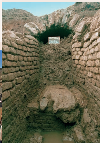
Pour la première fois, des fouilles archéologiques ont permis de découvrir: La limite d'un lot de construction d'une conduite d'eau romaine (Mechernich-Lessenich, Eifel)

Aucune autre conduite d'eau romaine de l'Imperium Romanum n'a été aussi bien étudiée que celle de l'Eifel jusqu'à Cologne, et pratiquement dans aucune autre conduite d'eau n'a-t-on trouvé autant d'aspects techniques de la construction antique qu'à celle du Rhin.