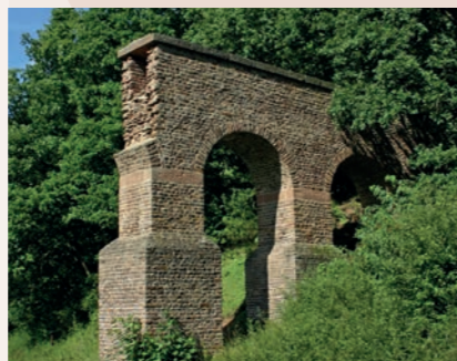
Merchernich-Vussemer, Eifel: Pont de l'aqueduc reconstitué à l'original

Ici, pour la première fois, la division d'un chantier antique en lots de construction a été prouvée archéologiquement : un bassin de dissipation massif a formé la jonction entre deux tronçons de ligne. Les bassins de captage des sources, les ponts, les réservoirs et les bassins de sédimentation ont non seulement fait l'objet de fouilles archéologiques, mais ils ont également été restaurés et, où nécessaire, recouverts de structures de protection et rendus accessibles au public le long du sentier de randonnée du Römerkanal – un des premiers sentiers de randonnée à thème archéologique en Allemagne. A l'aide de photos, de la documentation des fouilles et de maquettes, l'exposition donne un aperçu complet de la diversité de ce bâtiment architectural grandiose.