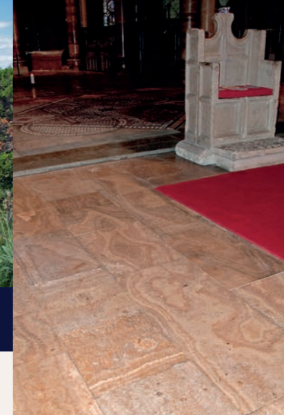
Un succès d'exportation au Moyen Âge: les concrétions de calcaire de la conduite d'eau de l'Eifel sous forme de marbre d'aqueduc placé sous le trône archiepiscopal à la cathédrale de Canterbury (Angleterre).

Étant donné, qu'au nord de l'Italie les voies de transport vers les ponts de marbre n'étaient plus utilisables pour les convois exceptionnels au Moyen Âge central et que, par conséquent, aucune pierre précieuse était disponible pour les bâtiments romains au nord des Alpes, les constructeurs ont dû trouver une alternative. Pour les églises, monastères et châteaux de Rhénanie construits à l'époque romaine, les pierres des canalisations d'eau ont été retirées afin d'obtenir des matériaux de construction – mais le but principal de ce „vol de pierres“ de l'époque était le dépôt de concrétions de calcaire, à partir duquel un marbre très particulier a été créé sous la main des tailleurs de pierre qualifiés.